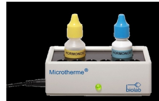
Microtherme® mit Reagenz

Das führt zu einer noch besseren Widerfindung und Reproduzierbarkeit der Messungen.