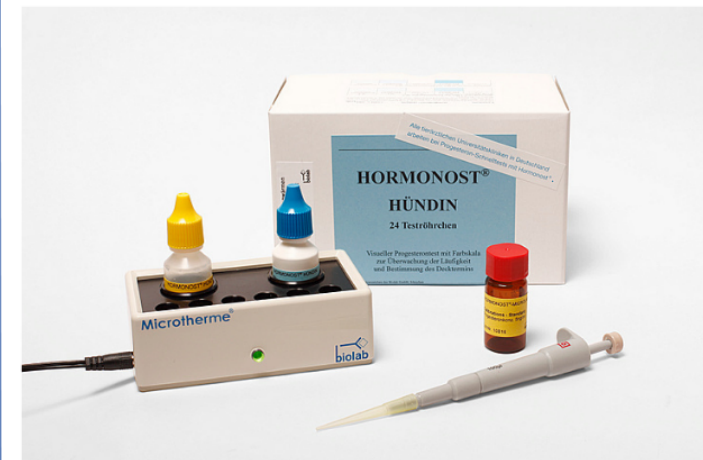
Microtherme®, Hormonost® Hündin und Zubehör